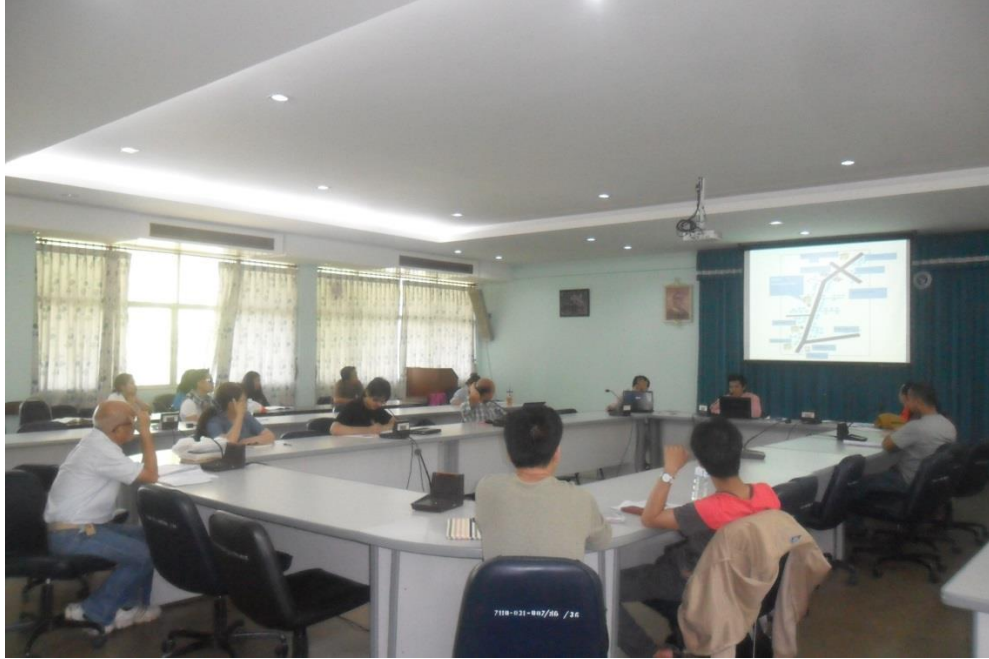
การสะท้อนปัญหาการเข้าถึงข้อมูลเชิงพื้นที่ ในโรงเรียน “ปอเนาะ” โดยซุลอัสรี มะละ