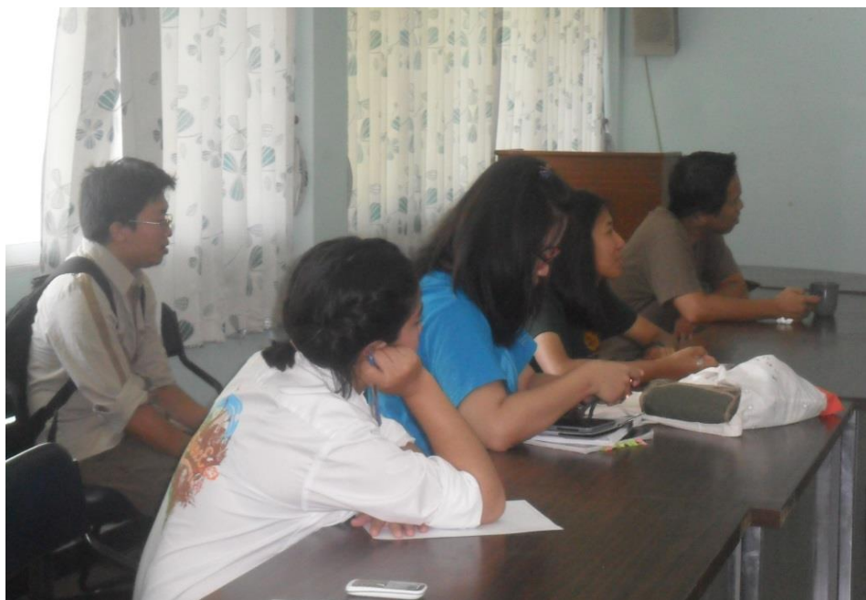
อีกมุมหนึ่งของนักศึกษาและผู้สนใจทั่วไปเข้าร่วมรับฟังเวทีดังกล่าว