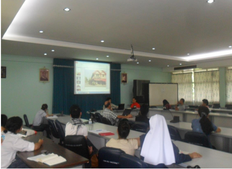
ลูกหลานคนยอกกับประสบการณ์สนามเมืองยอง จังหวัดลำพูน สะท้อนภาพโดย ธนวัฒน์ ปาลี